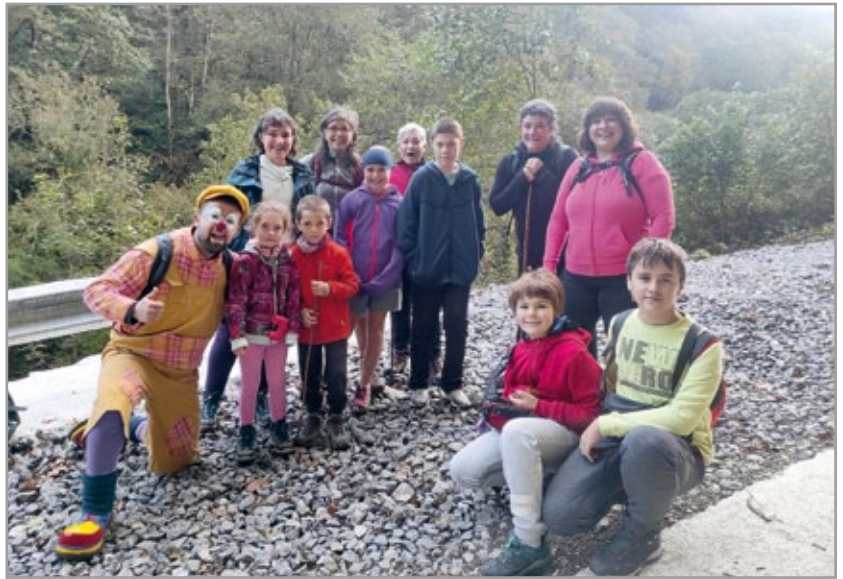
Ibilbidean parte hartutako kuadrila.