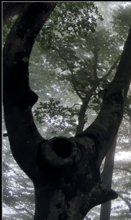
Lanbro artean ezkututzen.