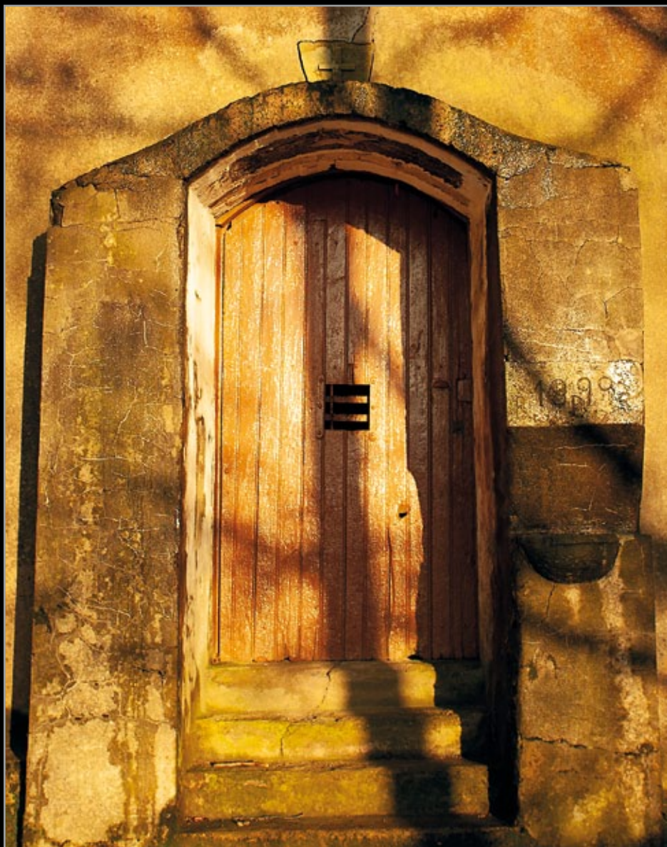
San Roken itzala.