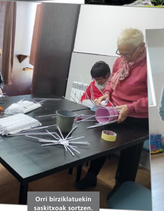
Orri birziklatuekin saskitxoak sortzen.