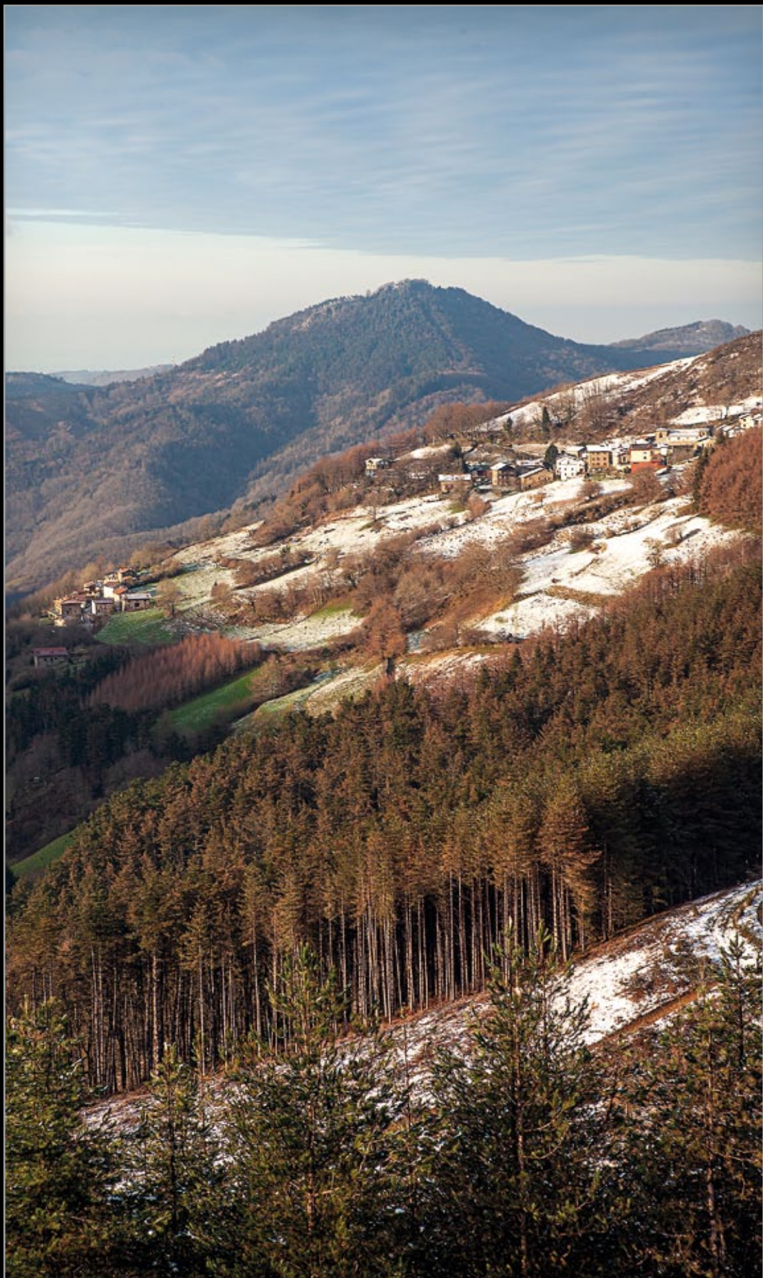
Elurra ageri, 2018ko otsailaren 8a.