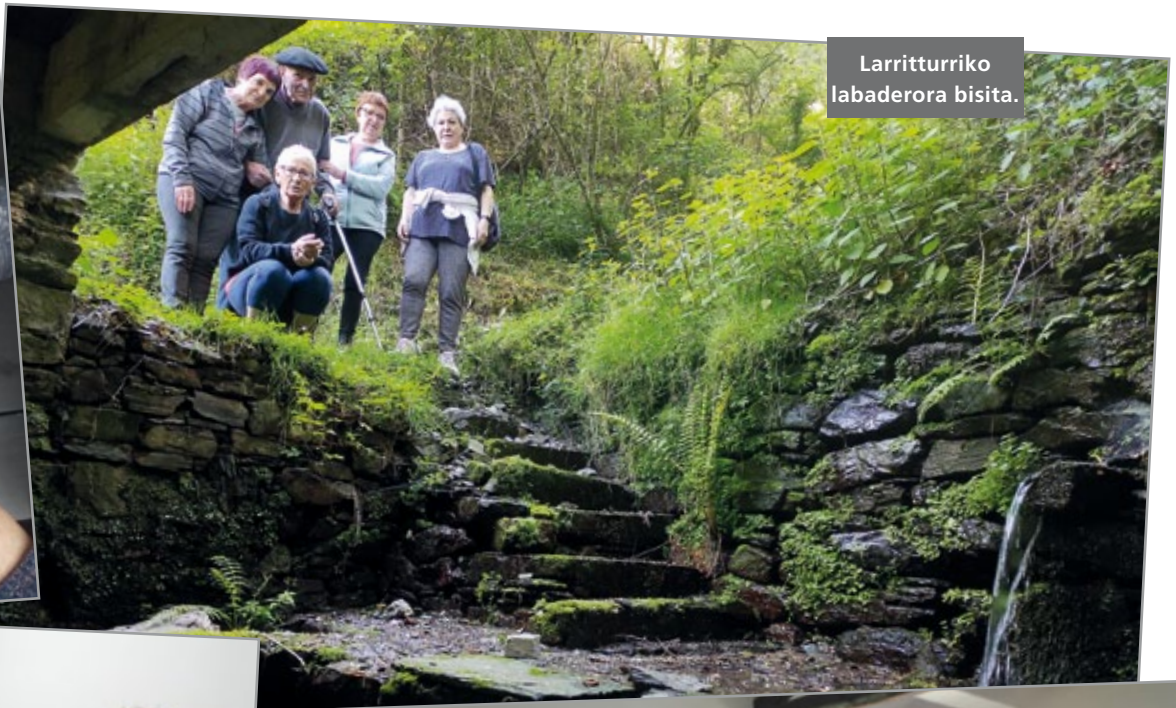
Larriturriko labaderora bisita.