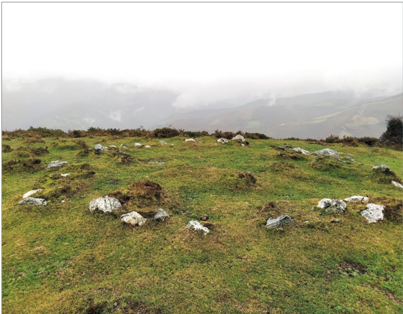
Antzinako monumentu megalitikoak.

Kokapena ere kezagarria da oso. Hitz hauek idazterako garairako zehatz erakutsi ez badute ere, herritik oso gertu paratzeko asmoa dutela pentsatzeko arrazoiak ditugu, haizetsuak dira gure gainak eta estimatuak izan dira lehenago ere. Badirudi oraingoan apustu serioa egiten ari direla, ez Aranon bakarrik, Euskal herria osoan.