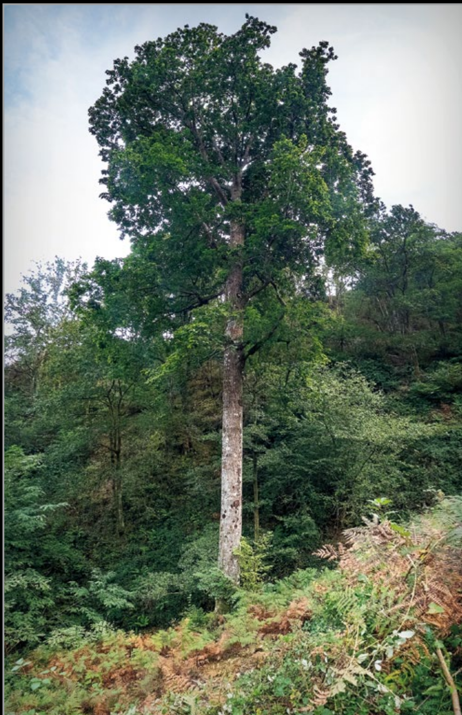
Aranoko Sherman generala, indultatutako norteko haitza .

Aurtengo aldizkarirako argazkiak Jon Mari Beasainek ateratakoak dira. Herriko ate pare bat, eta gainerakoan, batez ere, mendia eta natura, Aranoko edertasun eta aberastasunaren irudi. Momentu ederak erakusten dizkiguten argazkiak dira. Gozatu sorta honi begira!