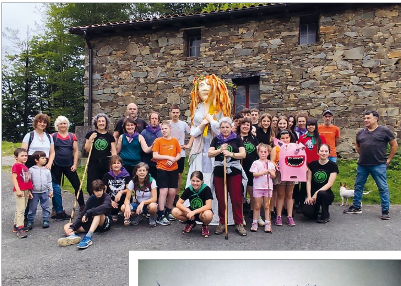
Lamixan herritarrekin Suron.

H auxe da istorio polit baten istorioa... "Bazen behin" formularik gabe hasi zena, baina hari-muturrak josiz herria lotzen joan dena.