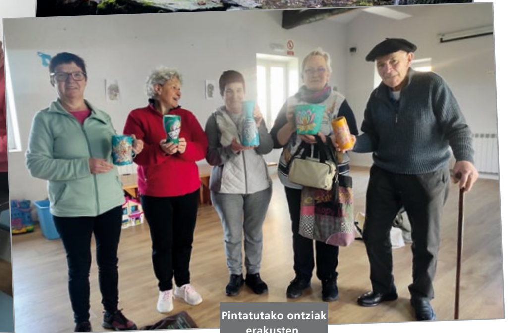
Pintatutako ontziak erakusten.