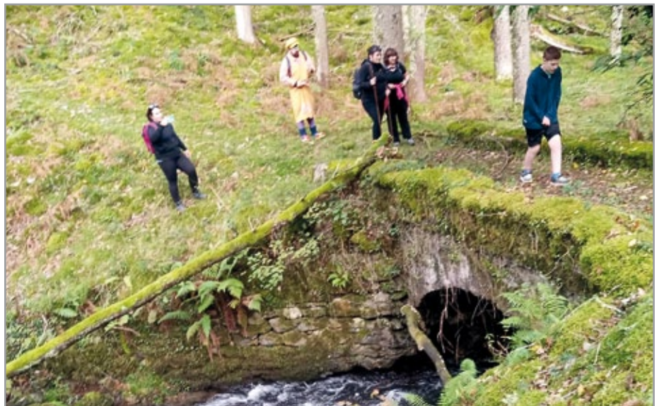
Beheko errotako zubitik pasatzen.

Herri ttiketako festetako egitarauak ez dira diruz bakarrik osatzen! Gauzak asko