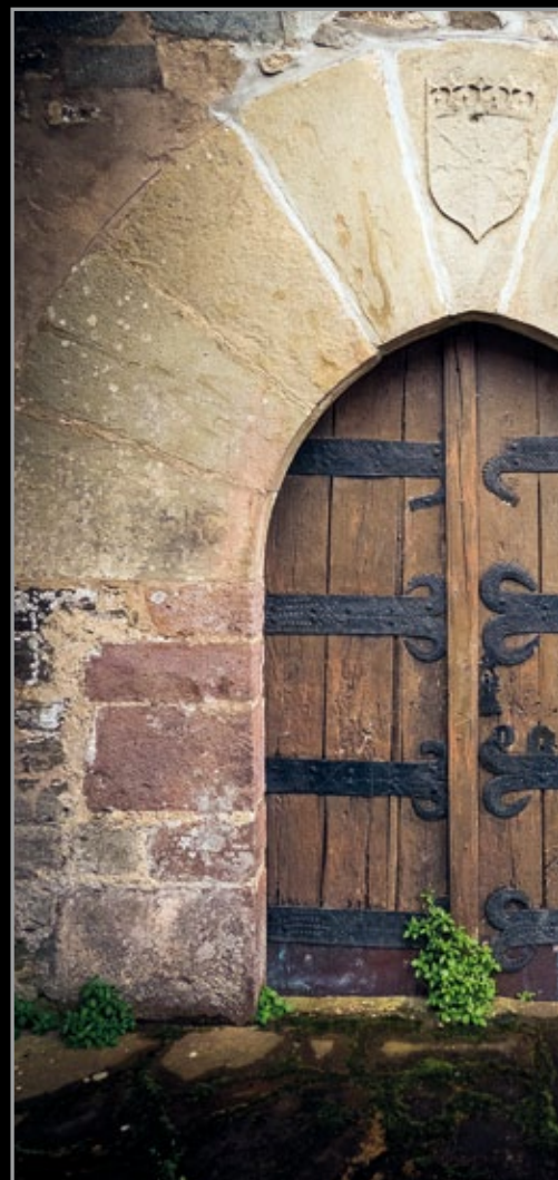
Armarri eta ate zaharrak.