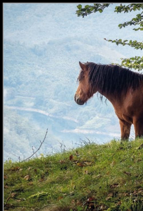
Goitik behera begira.