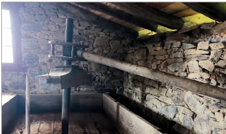
Gaztarazko-Bordako egurrezko tolarea.

kanaltxo horretatik sagarra estutzerakoan ateratzen zen muztioa bideratzen zen. Iskinetatik ere erortzen zela diote anai arrebeak.