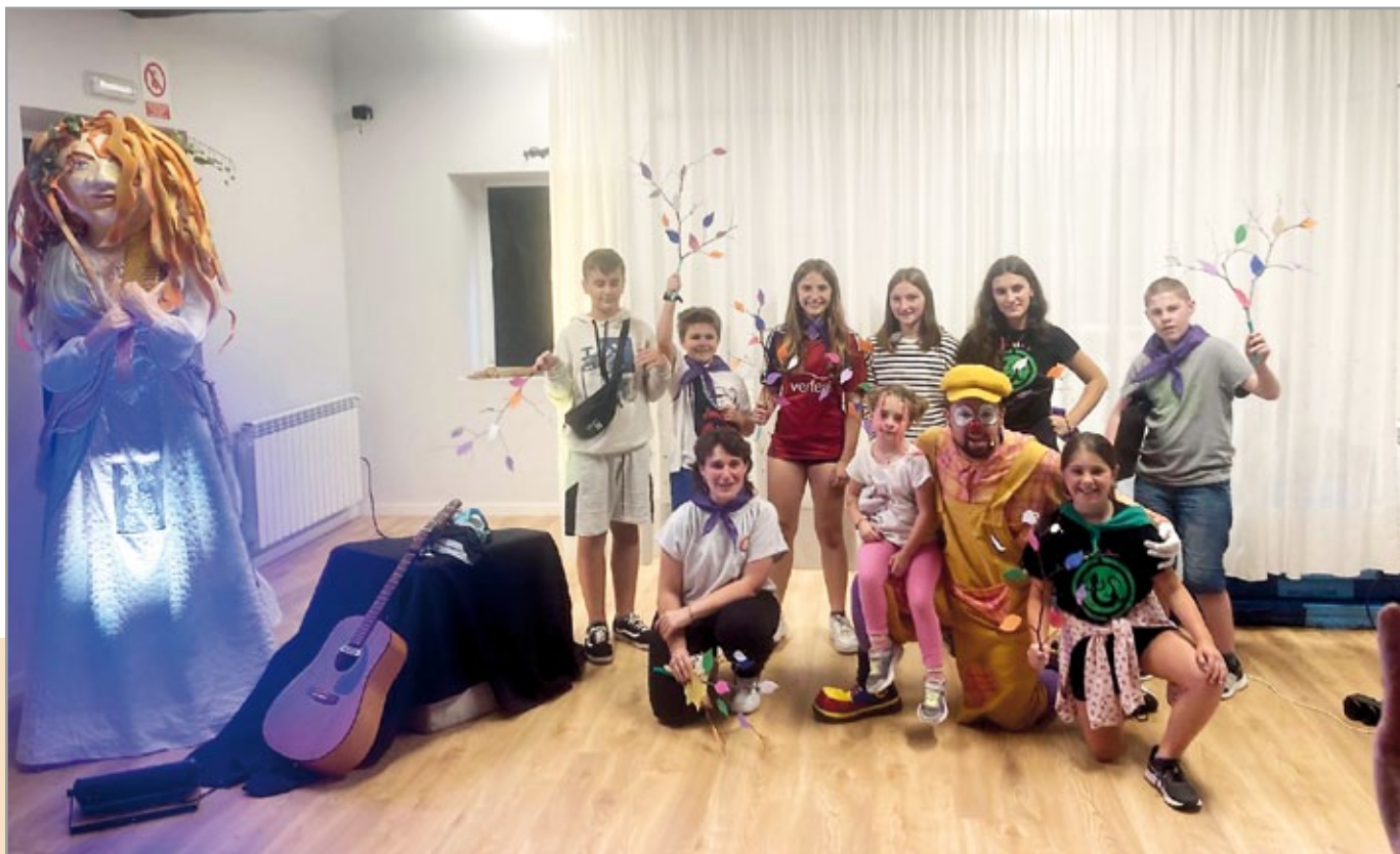
Ipuin kontaktako taldea.

Bide batez, kontuz ibili behar zutenak, gure putzura urreak liluratuta etortzen zirenak ziren! Igerilari trebe askoak larri ibili izan ziren gure putzuko zurrunbiloekein borrokatuz! Han igeri egitea ez zen edozeinentzat... Zer uste zenuten ba?